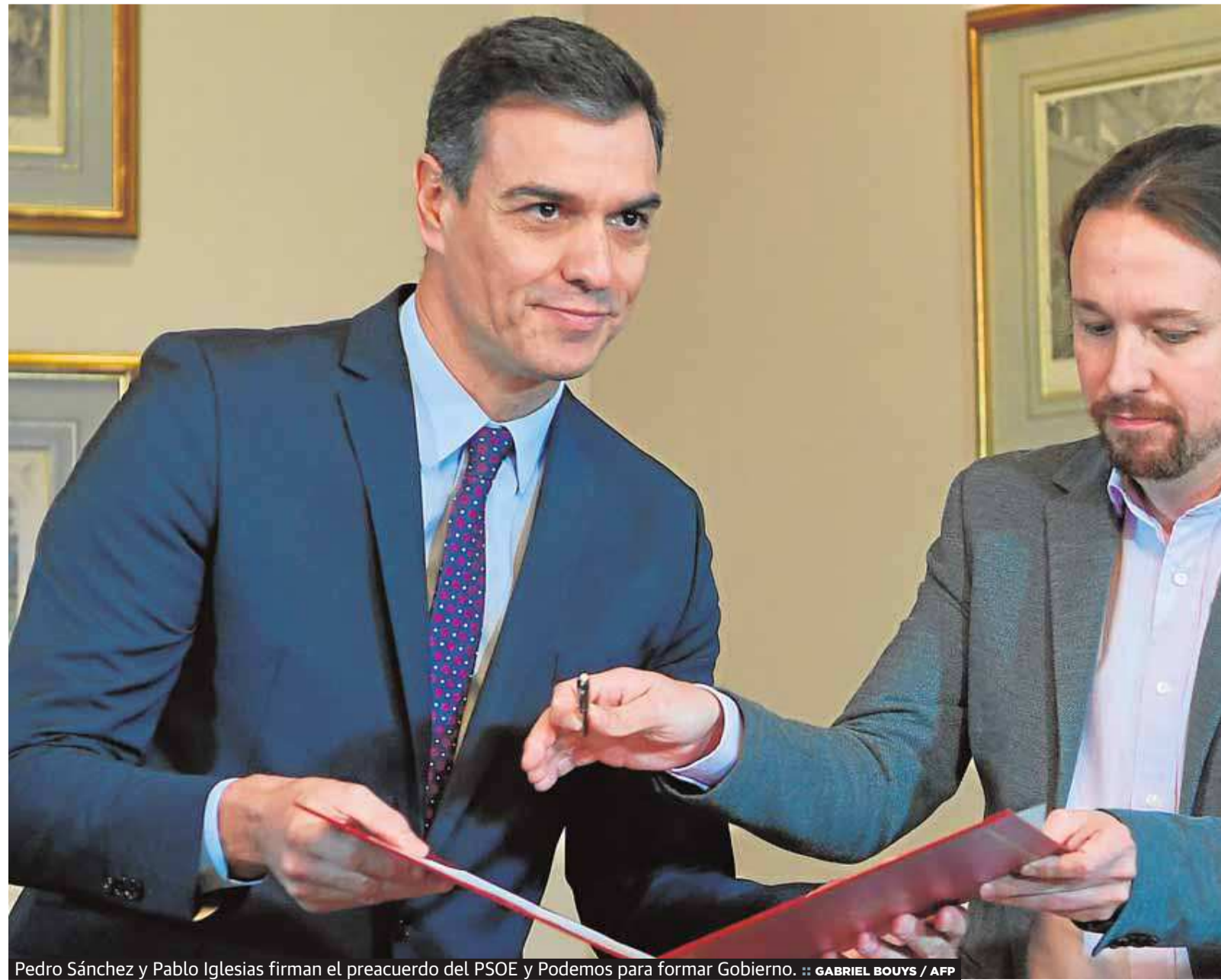
Pedro Sánchez y Pablo Iglesias firman el preacuerdo del PSOE y Podemos para formar Gobierno.

El representante agrario se muestra «desconcertado por la rapidez» de un «acuerdo fruto del miedo, porque consideran que su situación puede ir a peor». Le «preocupa que el PSOE de toda la vida haya dado