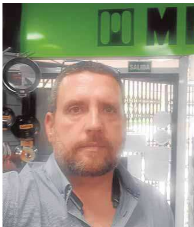
Electrodomésticos Ramón Llosá

«Llevo una caída del 96% en abril, incluso con repartos, y las facturas pendientes están ahí»