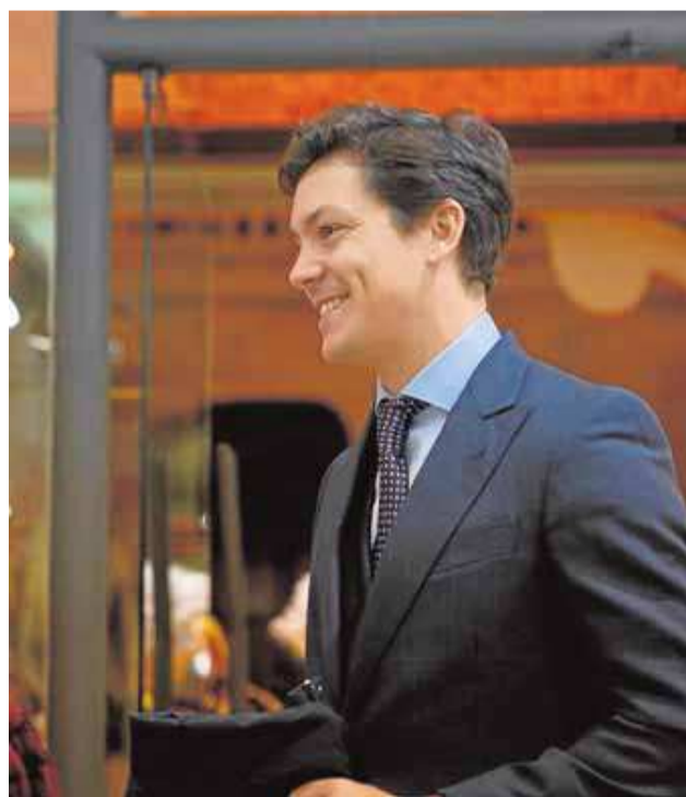
Textil Borja Ávila

de que cobrarán a final de mes, mientras el sector privado está obligado a cerrar y la mayoría de autónomos no cobrará o, para hacerlo, tendrá que pedir préstamos», en situaciones delicadas, como las que describen diversos asociados de Confecomerc.