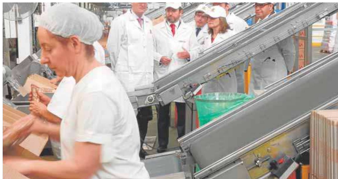
Trabajadores en la planta de Grefusa. M. GARCÍA