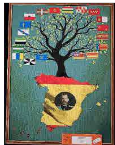
Lara Truyol, del CC La Salle d'Alaior, explica el seu arbre a Felipe VI a la trobada d'ahir.

per la pandèmia que es va iniciar en 2020.