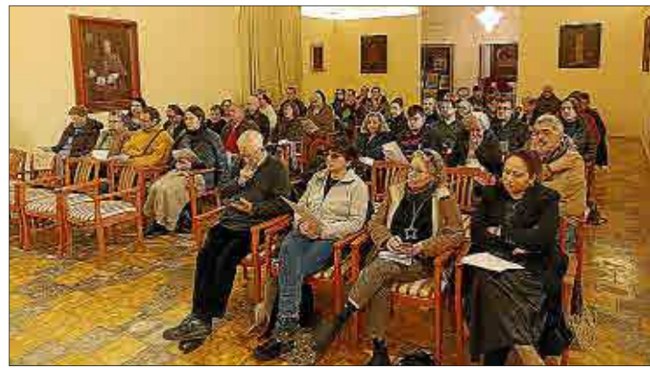
Els participants a la trobada.

La Creu Roja des Mercadal ha celebrat un acte de reconeixement als socis i sòcies que ja duen 50 anys a l'entitat. L'Ajuntament aprofita l'ocasió per agrair la col·laboració de totes les persones voluntàries i destaca la gran labor social que realitza l'entitat al municipi per construir una societat més solidària, empàtica i altruista.