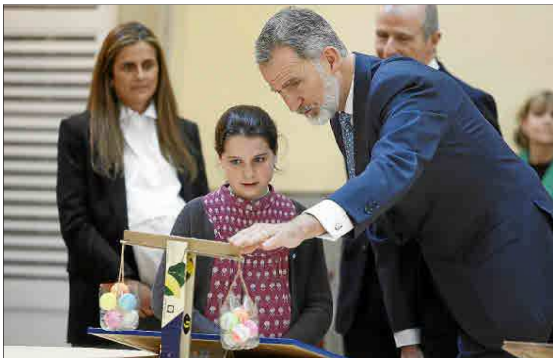
¿Qué es un rey? Felipe VI recibió ayer en el Palacio Real del Pardo a los 40 alumnos ganadores de las dos últimas ediciones del concurso escolar '¿Qué es un rey para ti?', promovido por la Fundación Institucional Española y Fundación Orange . Los jóvenes pudieron charlar con el Monarca y mostrarle sus proyectos y explicarle su motivación a la hora de desarrollarlos, ilustrando a través de su talento lo que supone para ellos la institución monárquica, así como lo que esta representa en la actualidad.