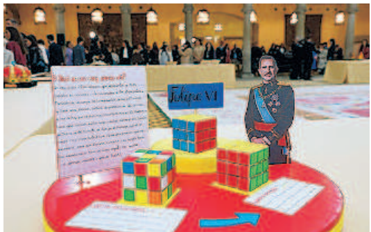
Ariadna, de 5º de Primaria, ve a España como un gran cubo de Rubik; y a Felipe VI como la mano que une ese puzle