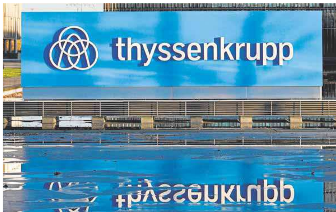
Sede central de ThyssenKrupp Galmed en Alemania.