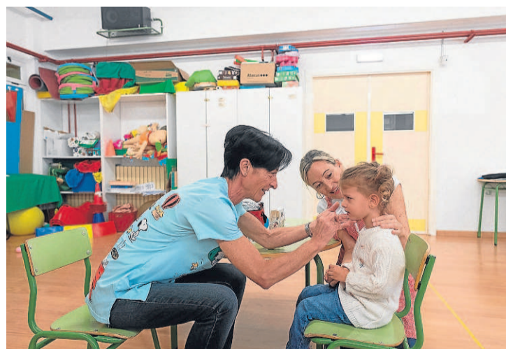
Inmunización frente a la gripe en un colegio. FRANCISCO JIMÉNEZ

«El salto en cantidad y calidad que se ha alcanzado es extraordinario»