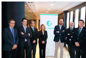
Encuentros de Expertos sobre diversas cuestiones de interés, temáticos y por CCAA