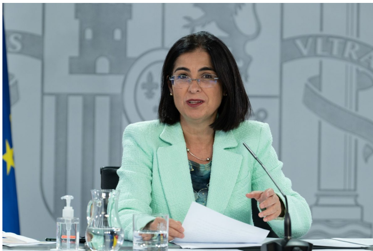
La ministra de Sanidad, Carolina Darias.