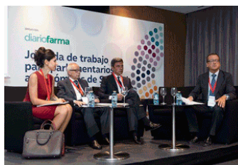
Actividades y jornadas destacadas organizadas por Diariofarma