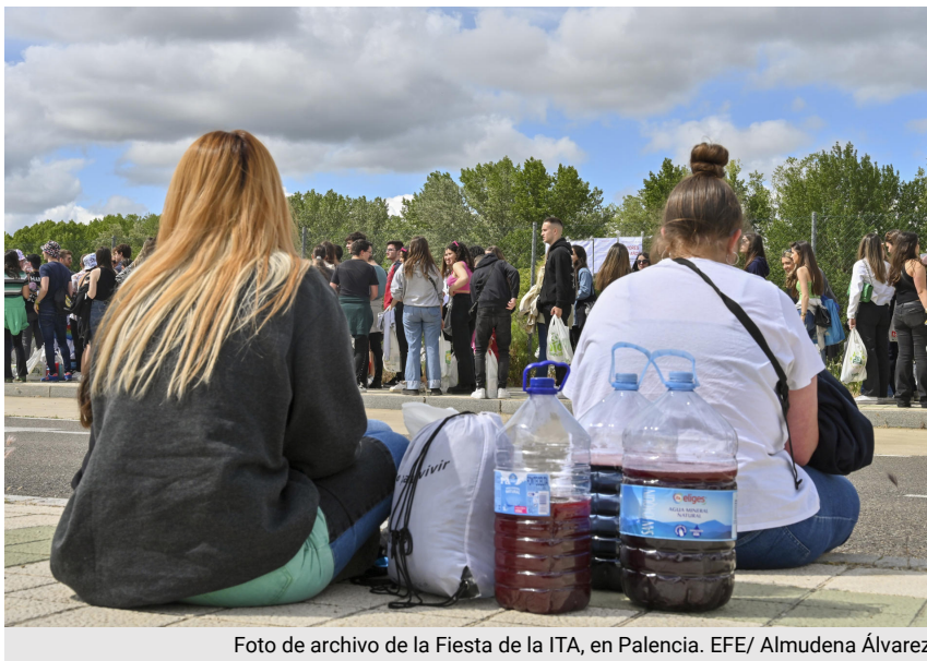
Foto de archivo de la Fiesta de la ITA, en Palencia.

https://efe.com/salud/2024-02-21/adolescentes-bebidas-energeticas-riesgos-peores-notas-consumo-droga/