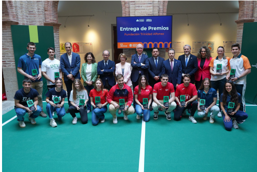
Los mejores deportistas universitarios

Dos estudiantes y deportistas de la Universitat de València reciben sendos premios al haber sabido compaginar la excelencia académica y la práctica deportiva de élite.