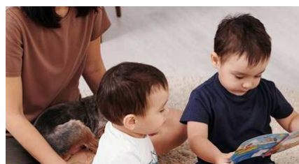
Más de 212.000 euros de ayudas a familias con hijos nacidos de partos o adopciones múltiples