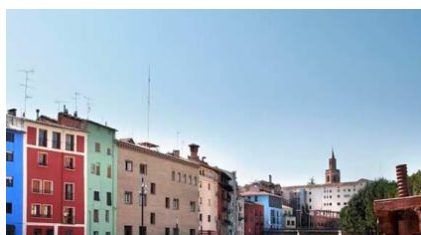
Aragón notifica 231 nuevos positivos de Covid con Barbastro a la cabeza