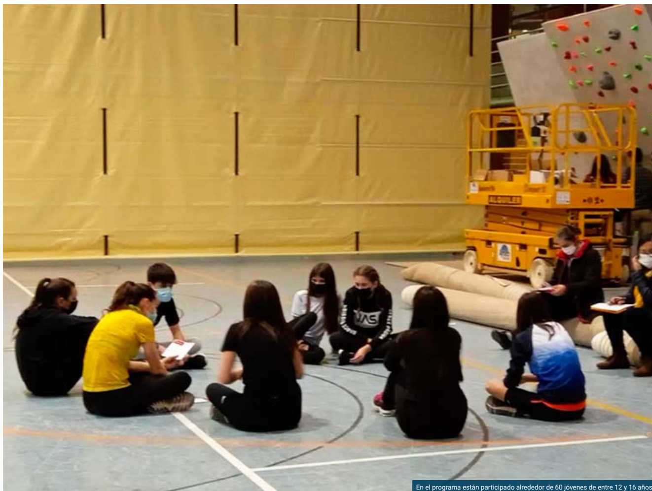
En el programa están participado alrededor de 60 jóvenes de entre 12 y 16 años

El programa de prevención de las adicciones y de la violencia “Juega, Vive”, desarrollado por la Oficina de las Naciones Unidas Contra la Droga y el Delito (Unodc), entra en la segunda fase de pilotaje en Aragón. Durante los pasados días 26 y 28 de febrero y 1 de marzo, se han celebrado en Graus, Utrillas y Tarazona las sesiones intermedias de evaluación, en las que están participado alrededor de 60 jóvenes de entre 12 y 16 años con diferentes perfiles. También acudieron los consejeros de Deporte y de Servicios Sociales de los municipios, así como los técnicos de la Dirección General de Salud Pública.