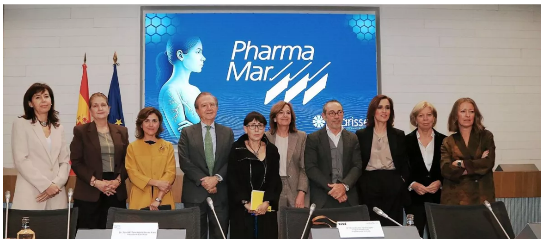
PharmaMar y la CEOE han celebrado una jornada sobre la brecha de género en el abordaje del cáncer de pulmón