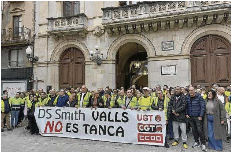
Concentración de los trabajadores de las plantas de International Paper en Valls y Montblanc.

Este grupo es el propietario de la empresa Matias Gomà Tomàs, que cuenta con una planta de papel reciclado en La Riba (Alt Camp)