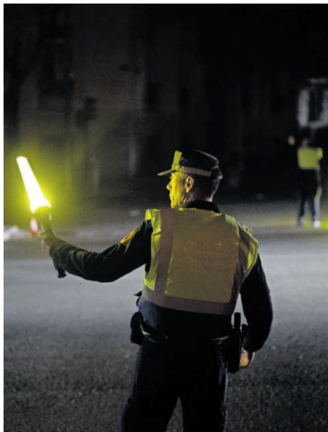
Un agente de la Policía Municipal dirige el tráfico tras el apagón eléctrico en Madrid, el 28 de abril del año pasado.

La diferencia entre esta cantidad y la que anunció el año pasado es que en esta última están solo incluidos los daños del día 28 y en los 175 millones, los causados por otro incidente previo