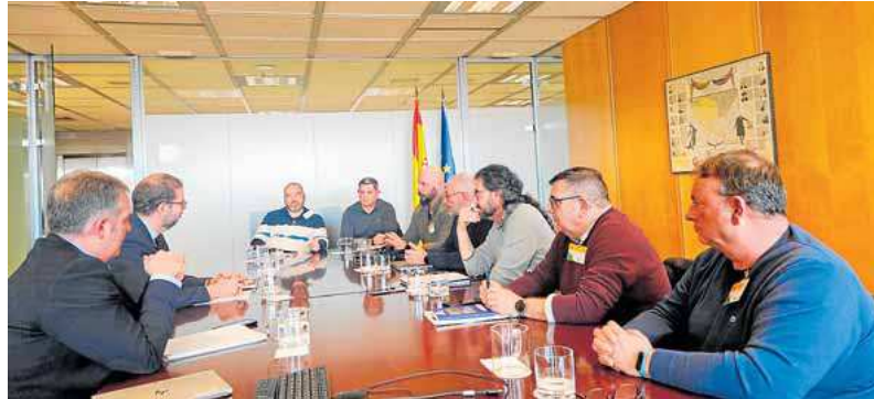
Reunión entre el comité de empresa y responsables del Ministerio de Industria, ayer. COMITÉ

Los sindicatos avanzaron a este diario que lo que proponen es la instalación de una caldera de biomasa y otra eléctrica para reducir las emisiones y el consumo de gas natural, disminuyendo el precio por kilo y haciendo el plástico verde. Cabe recordar también que Sabc ya ha realizado inversiones para reducir su factura energética con la instalación de placas fotovoltaicas. «Esperamos que esto, junto con la presión del Gobierno de España, haga que el nuevo comprador de la compañía se decida a llevar nuestro plan a cabo y, de esta manera, mantener el empleo