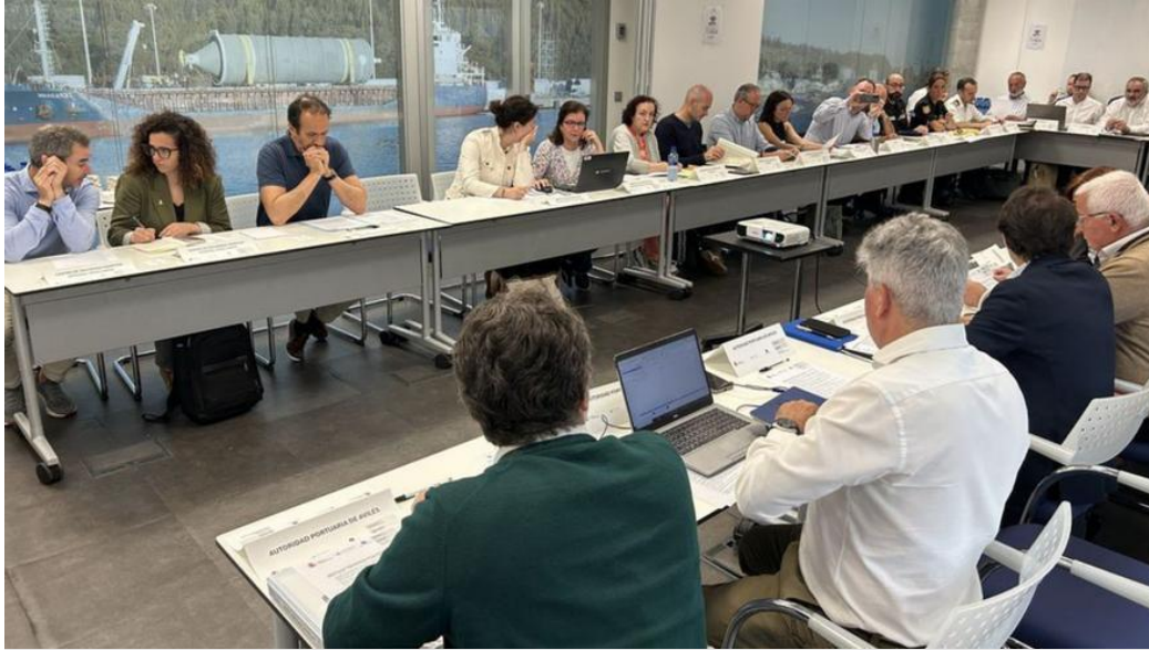
Un momento de la reunión de seguimiento con los participantes en el simulacro. | C. M. A.

avilés,puerto de Avilés,contaminación,simulacro