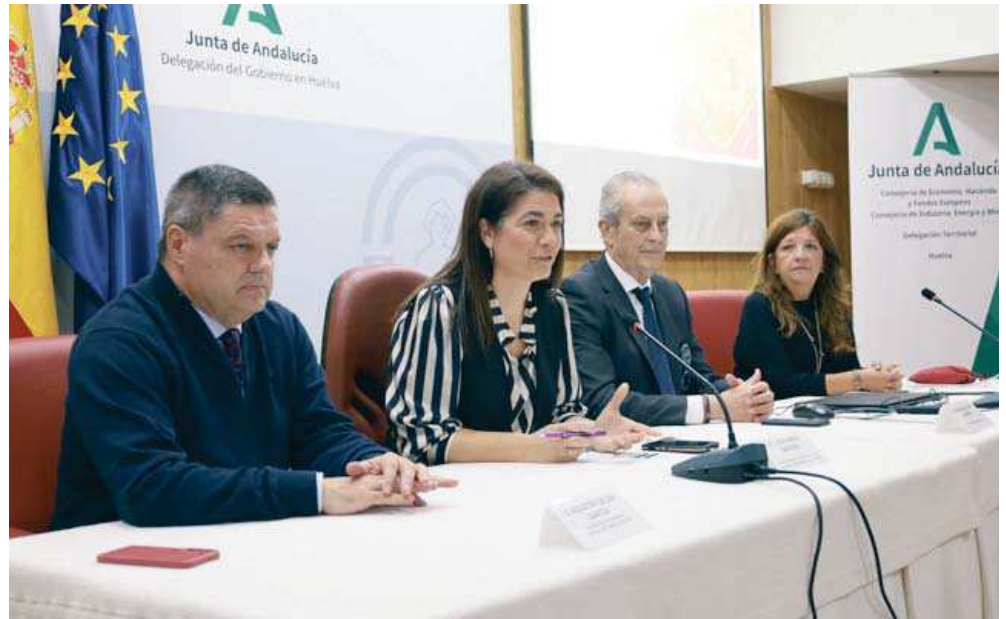
Jornada ‘La Industria Andaluza por bandera’ celebrada este lunes en Huelva.

La delegada ha destacado la “importancia” de “poner en valor la capacidad de la industria para generar progreso, empleo y cohesión territorial”