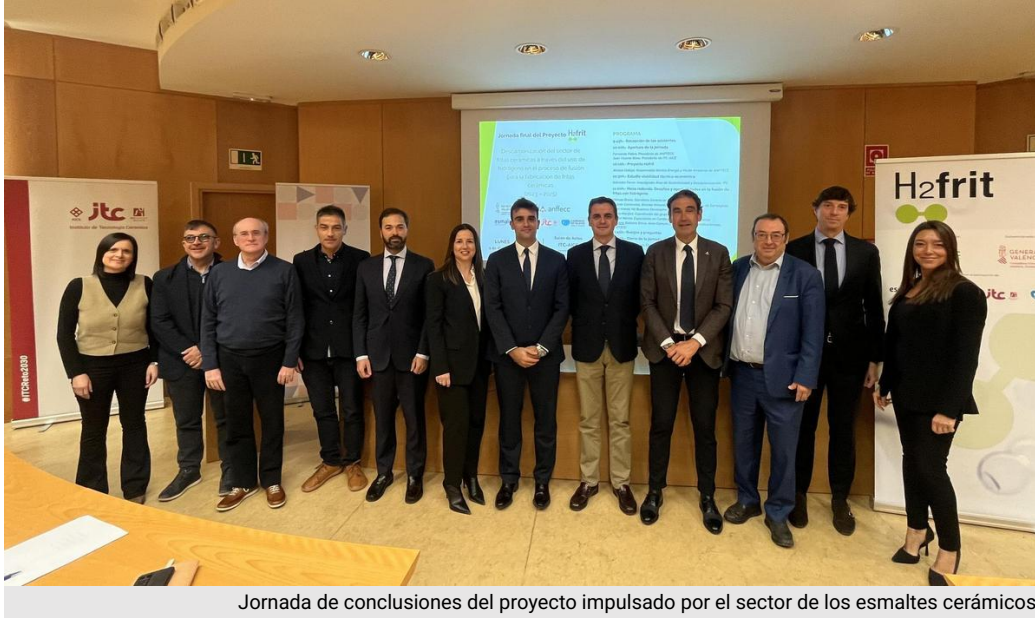
Jornada de conclusiones del proyecto impulsado por el sector de los esmaltes cerámicos.

Industria,internacional,investigación,Anffecc,gas,Med's Tile