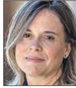
Fina Lladós PRESIDENTA DE FARMAINDUSTRIA