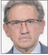
Jaume Giró EXCONSELLER DE ECONOMÍA