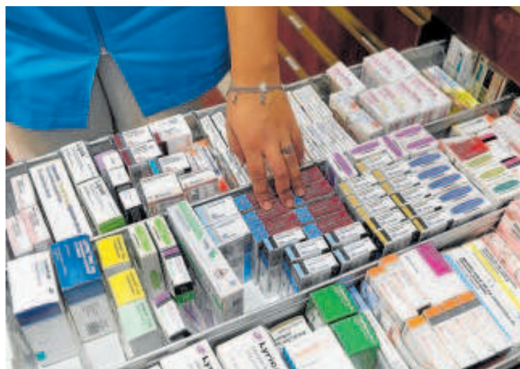
Medicamentos en una farmacia española

Por todo ello, Farmaindustria propone siete medidas para acelerar la inversión farmacéutica en España, como el desarrollo de un marco regulatorio que promueva la innovación. Esta propuesta se da, además, en un contexto en el que el Ministerio de Sanidad está preparando la reforma de la ley del Medicamento, que ha generado tensiones con el sector por el modelo que propone de precios seleccionados, pues este considera que pondría en riesgo el abastecimiento de medicamentos y el tejido industrial.