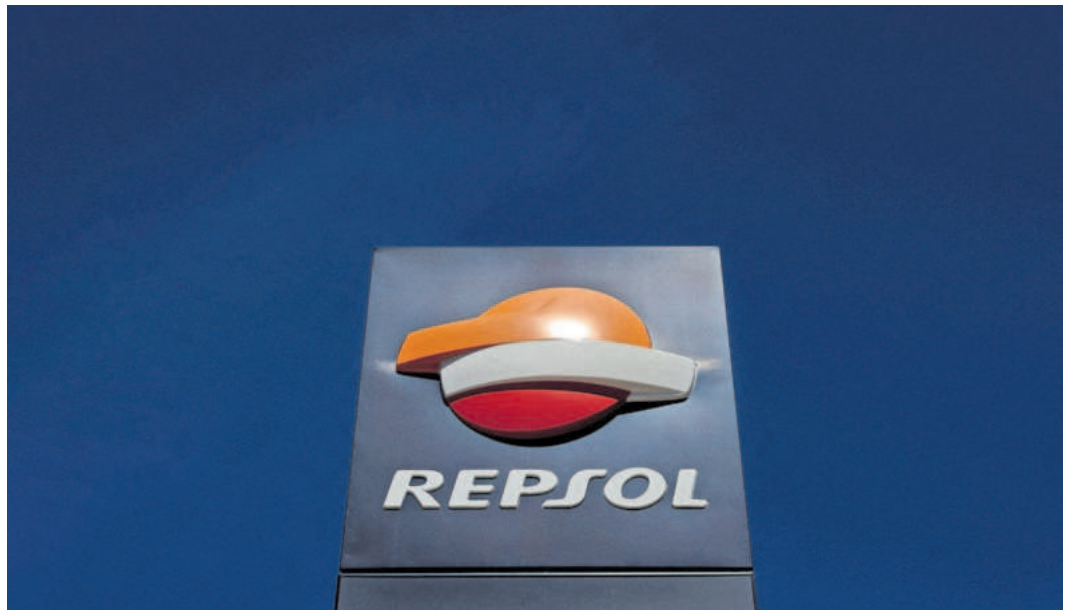
Logo de Repsol en una estación de servicio del grupo.

En los últimos días se han producido algunas mejoras de la valoración. Morgan Stanley, por ejemplo, la ha elevado el 8%, hasta 14,40 euros, y sus analistas piensan que "la reciente fortaleza de Repsol tan solo ha revertido parte de la debilidad prolongada que llevamos viendo un tiempo". Detallan cinco aspectos que les hace estar positivos con la petrolera: unos márgenes de refino mejores de lo esperado, la expo-