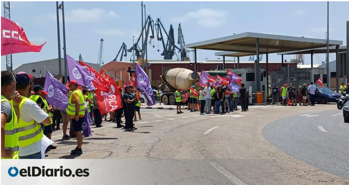
Protesta de los trabajadores de Fertiberia este viernes en Sagunto.