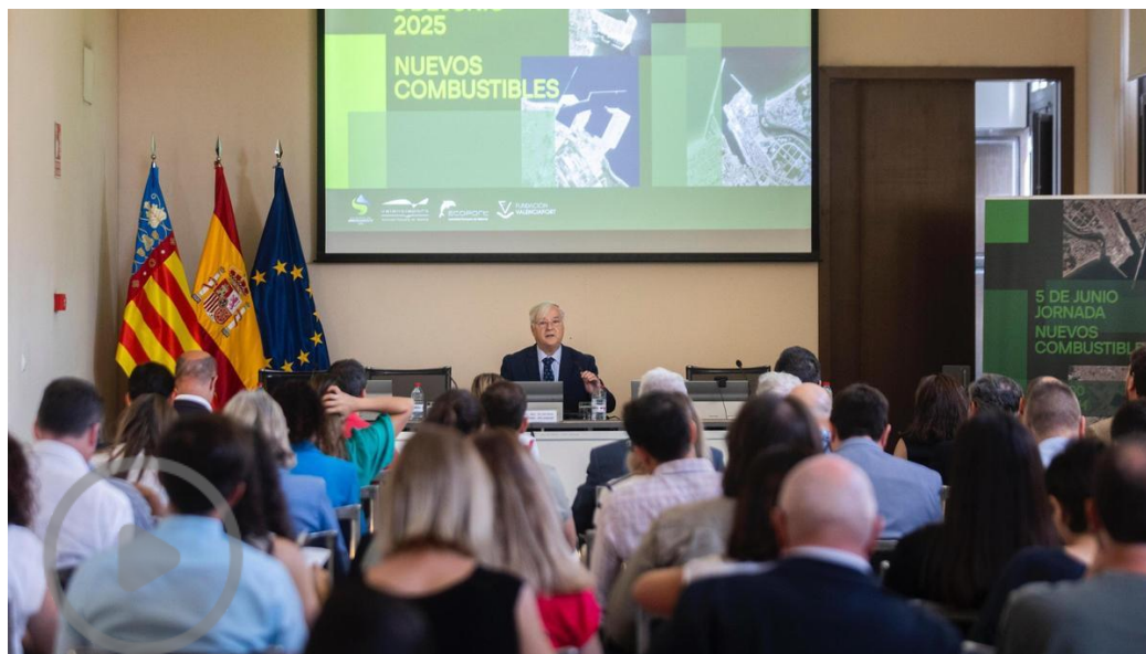
Las empresas de la comunidad portuaria se vuelcan con la energía limpia

empresas,energía,vehículos,combustible,consumo,inversión,Gas Natural