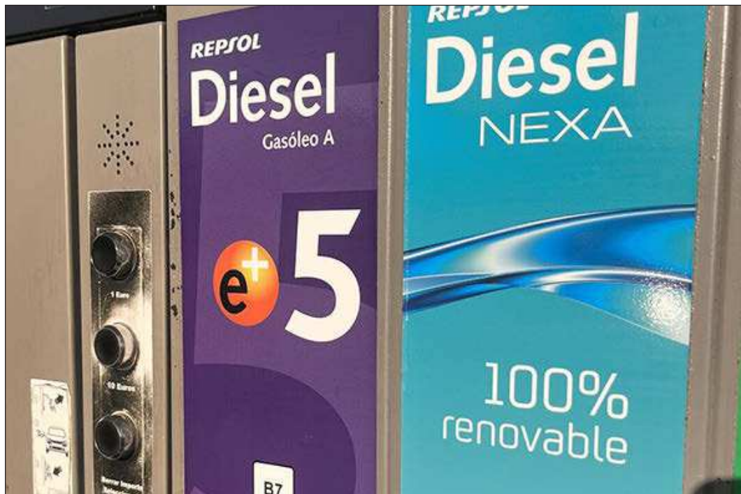
El nuevo diésel que ofrece la petrolera ya en 122 estaciones de servicio. EE

Entre las características destacadas se encuentran una detergencia