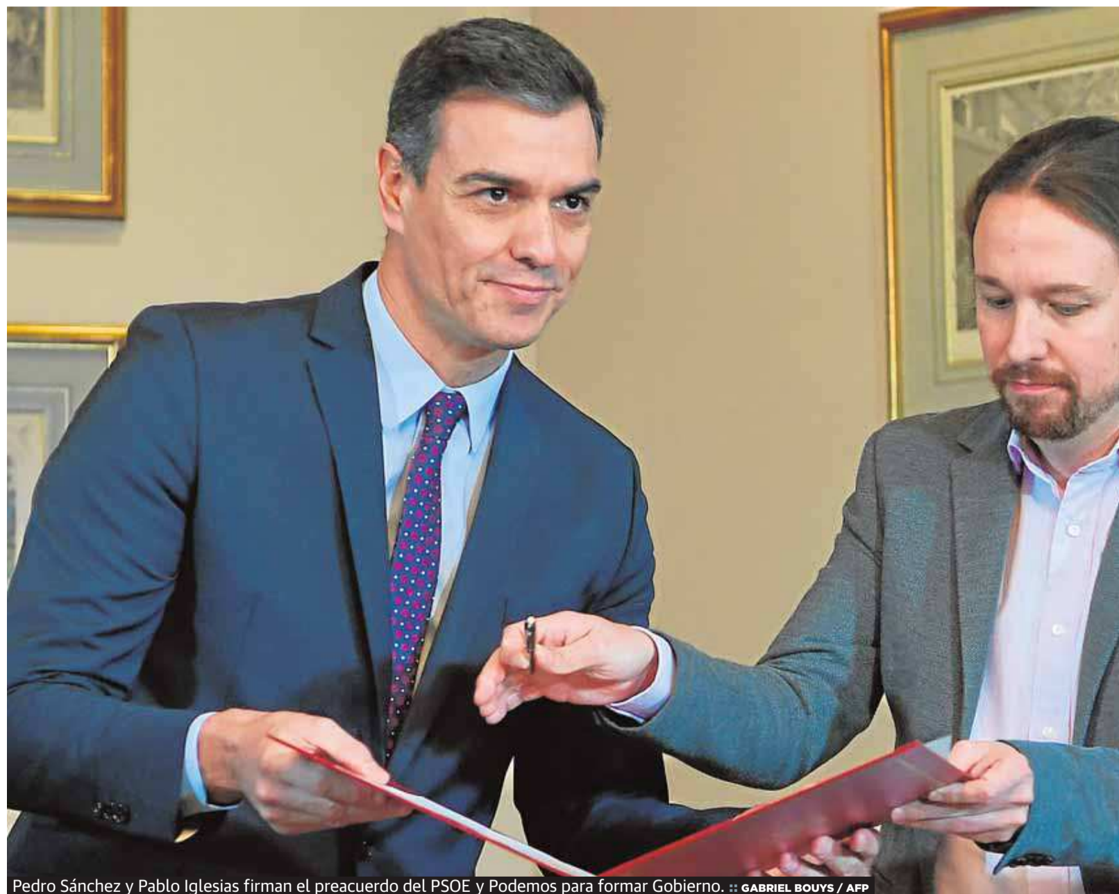
Pedro Sánchez y Pablo Iglesias firman el preacuerdo del PSOE y Podemos para formar Gobierno.

El representante agrario se muestra «desconcertado por la rapidez» de un «acuerdo fruto del miedo, porque consideran que su situación puede ir a peor». Le «preocupa que el PSOE de toda la vida haya dado