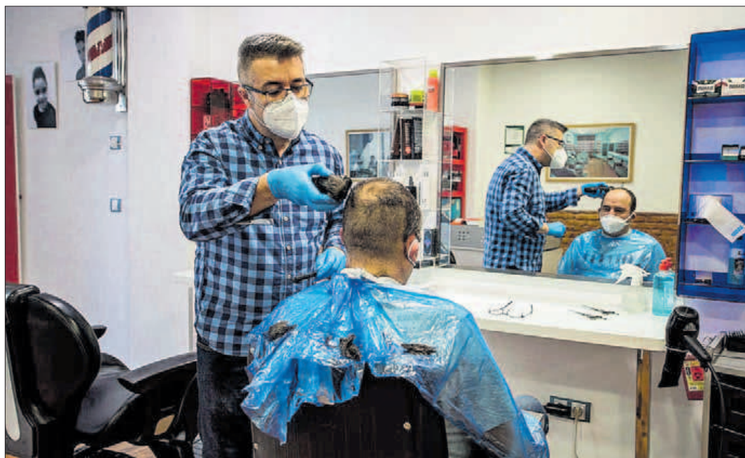
Un peluquero atiende ayer a uno de sus primeros clientes tras la reapertura. FERNANDO BUSTAMANTE

La apertura de las peluquerías se esperaba como agua de mayo, ayer era el comercio más deseado. «Tenemos lista de espera y está todo el mundo con muchas ganas. Nos piden muchas cosas. Color,