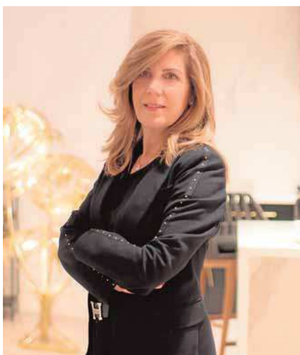
Mueble Gloria Vaquer

«Las tiendas están llenas de colchones y muebles que no se pueden entregar ni cobrar»