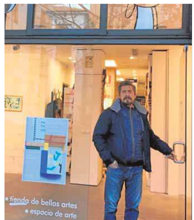
Bellas Artes Luis Viguer

«Me preocupa cuánto costará abrir exposiciones y recuperar la actividad en academias»