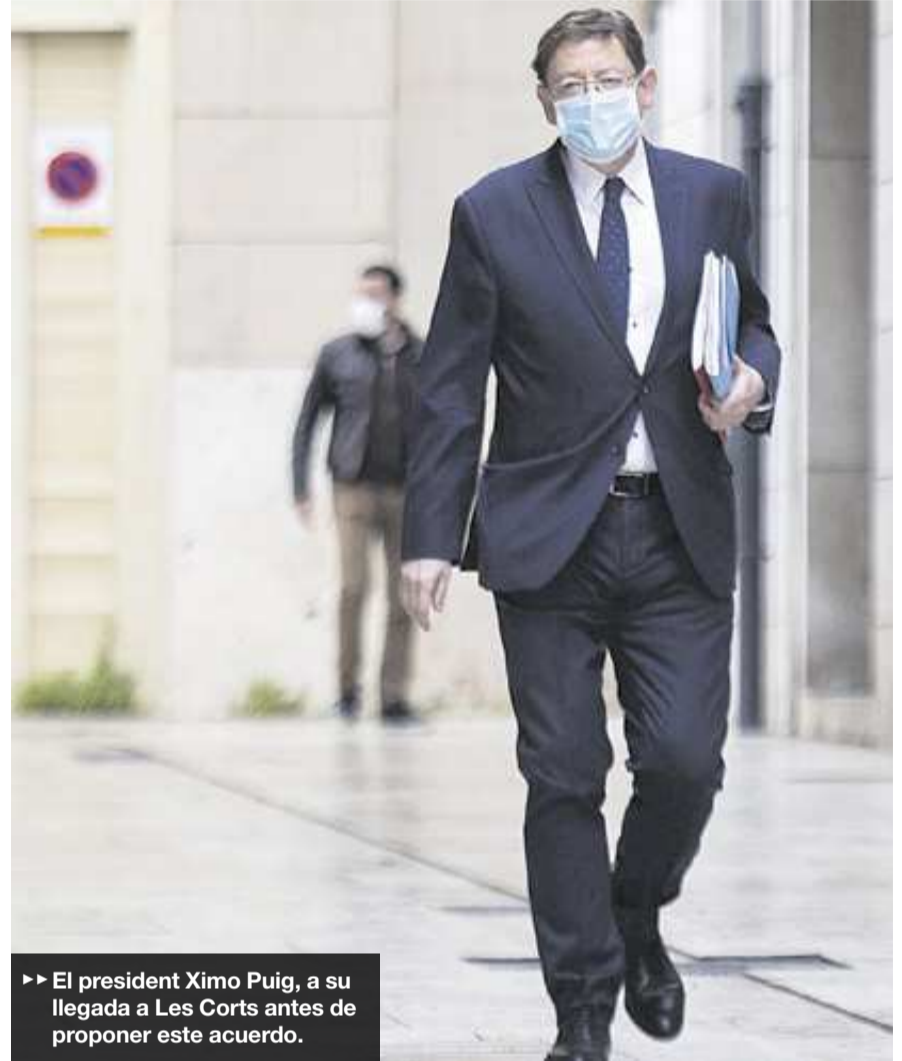
▶▶ El president Ximo Puig, a su llegada a Les Corts antes de proponer este acuerdo.

Desde ámbitos empresariales específicos hay peticiones para