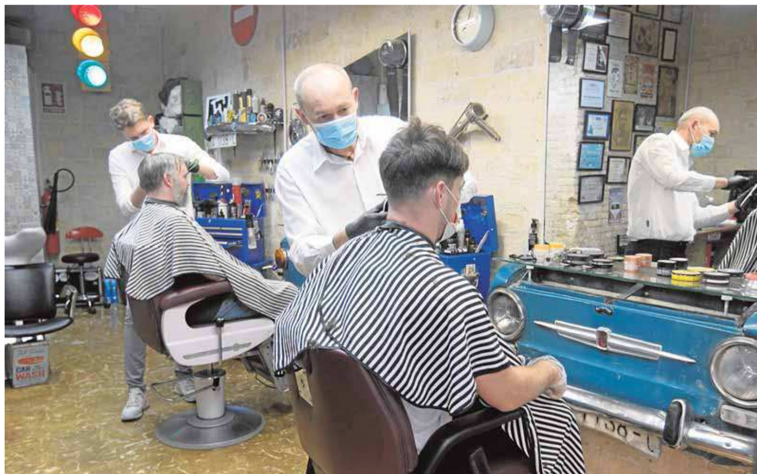
Unos peluqueros trabajan en un establecimiento abierto ayer en Valencia. DAMIÁN TORRES

Los hosteleros aprovecharon la reunión con Maroto para solicitar la flexibilización de los ERTE por fuerza mayor y establecer su cobertura hasta el 31 de diciembre de 2020; 25.000 microcréditos de rápida conce-