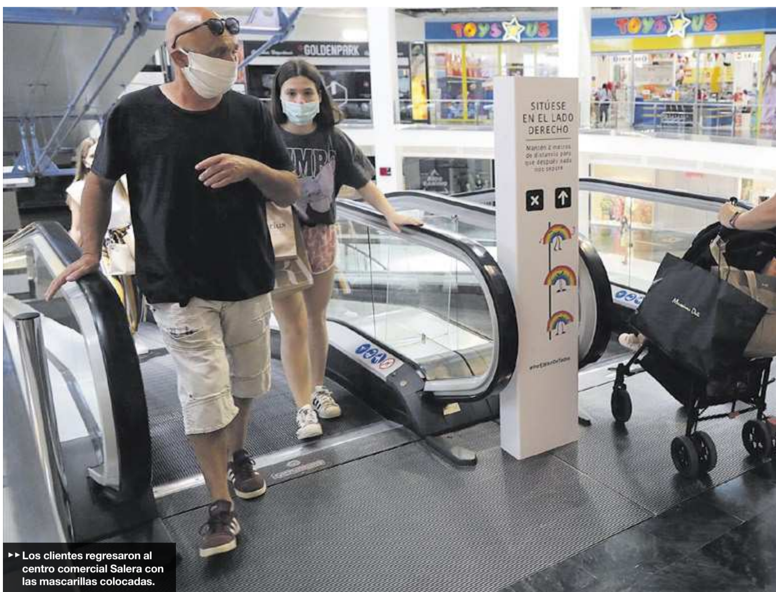
► Los clientes regresaron al centro comercial Salera con las mascarillas colocadas.

RECORRIDOS // Por otro lado, en el centro comercial Salera ya están en funcionamiento las normas de uso en las áreas comunes, con puertas independientes de entrada y salida, el conteo automático de asistentes o recorridos marcados en el suelo. La inmensa mayoría de operadores ya están abiertos, a falta de algunos dedicados a la venta de ropa, que lo harán en breves días, una vez concluya el proceso de adaptación a las actuales normas sanitarias.