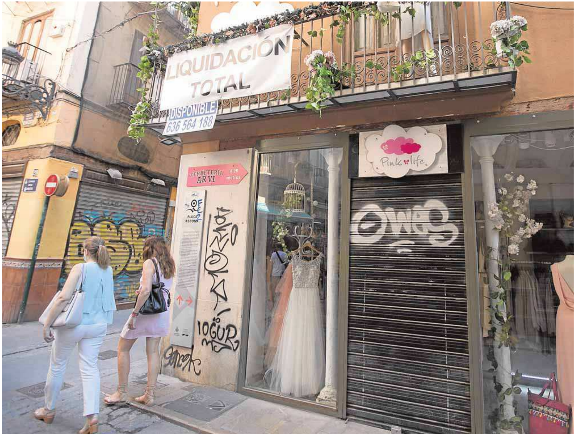
▲ Carteles. Anuncio de liquidación de existencias de un comercio en la calle Derechos, cerca de la plaza Redonda. DAMIÁN TORRES