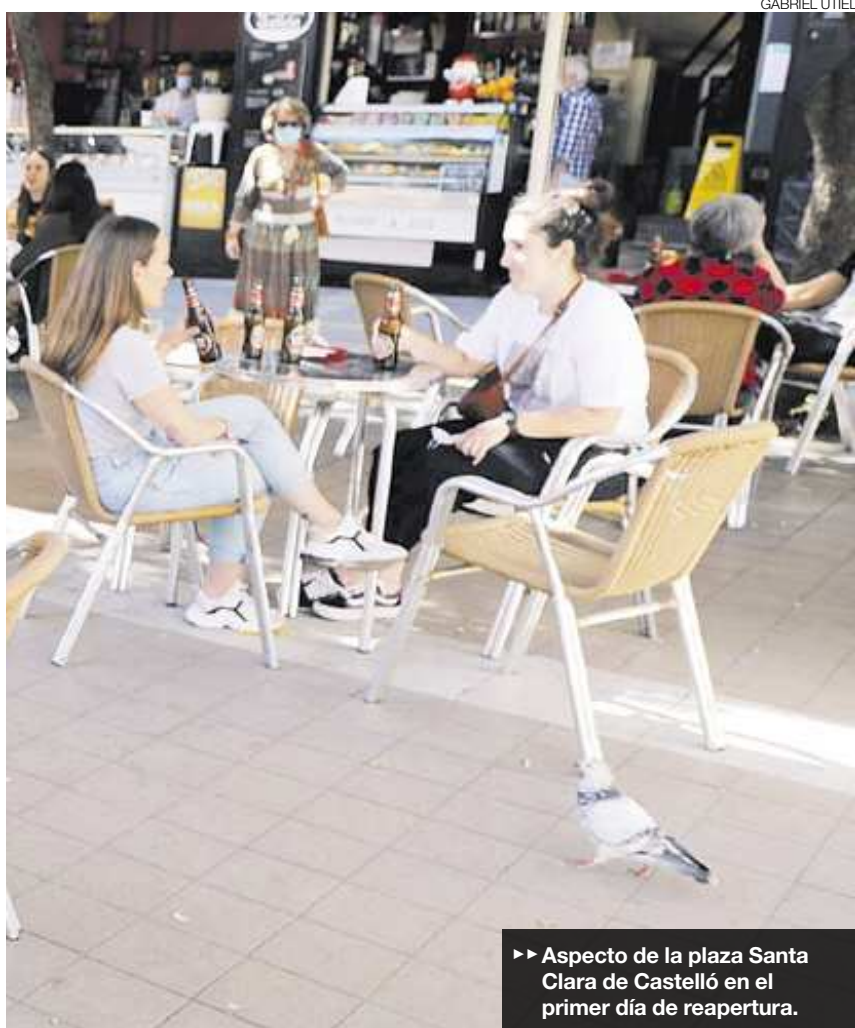
Aspecto de la plaza Santa Clara de Castelló en el primer día de reapertura.

La mayor parte de gente que vuelve a trabajar forma parte del colectivo de los autónomos