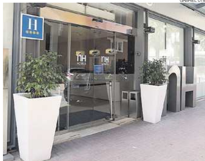
Los alojamientos hoteleros esperan a otras fases para su regreso.

Es por ello, y por las condiciones restrictivas contempladas en la fase 1, que son muy pocos los negocios de este tipo que han optado por recuperar la normalidad. Desde la principal organización del sector, Ashotur, señalan que apenas son el hotel Real de Castelló, que ha permanecido de guardia en todo momento, y otros alojamientos dispersos en la Plana Alta y Baixa o Els Ports. En todos estos casos, el objetivo perseguido es el de atender a aquellos que deben moverse entre provincias al formar parte de actividades consideradas como esenciales, y que